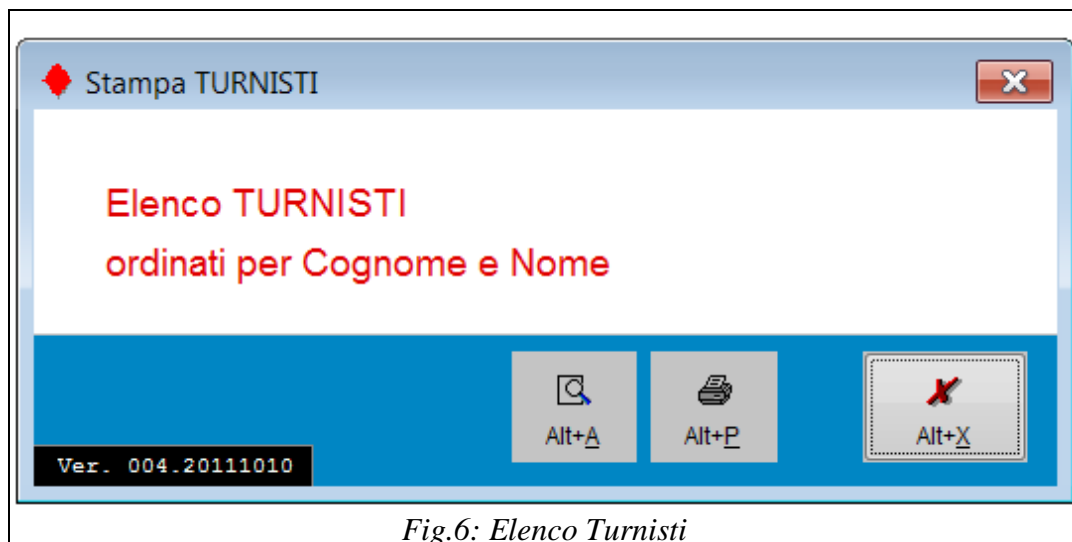
Fig.6: Elenco Turnisti